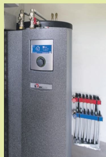
Luchtwarmtepomp benut het temperatuurverschil tussen binnen en buiten.

letterlijk warmpjes bij. ‘In de koude maanden is het binnen behaaglijk warm en ‘s zomers lekker koel. Ideaal.’