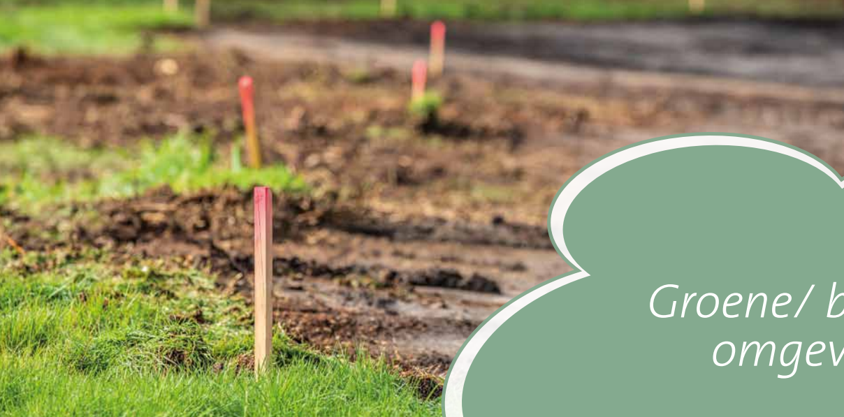
Groene/ bosrijke omgeving